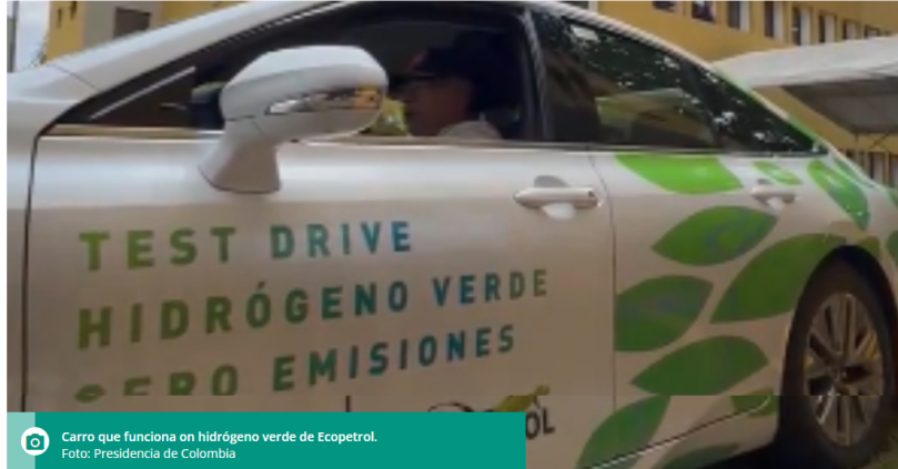
Carro que funciona en hidrógeno verde de Ecopetrol.

Ecopetrol presentó el nuevo Instituto Colombiano del Petróleo y las Energías de la Transición para la explotación de energías renovables.