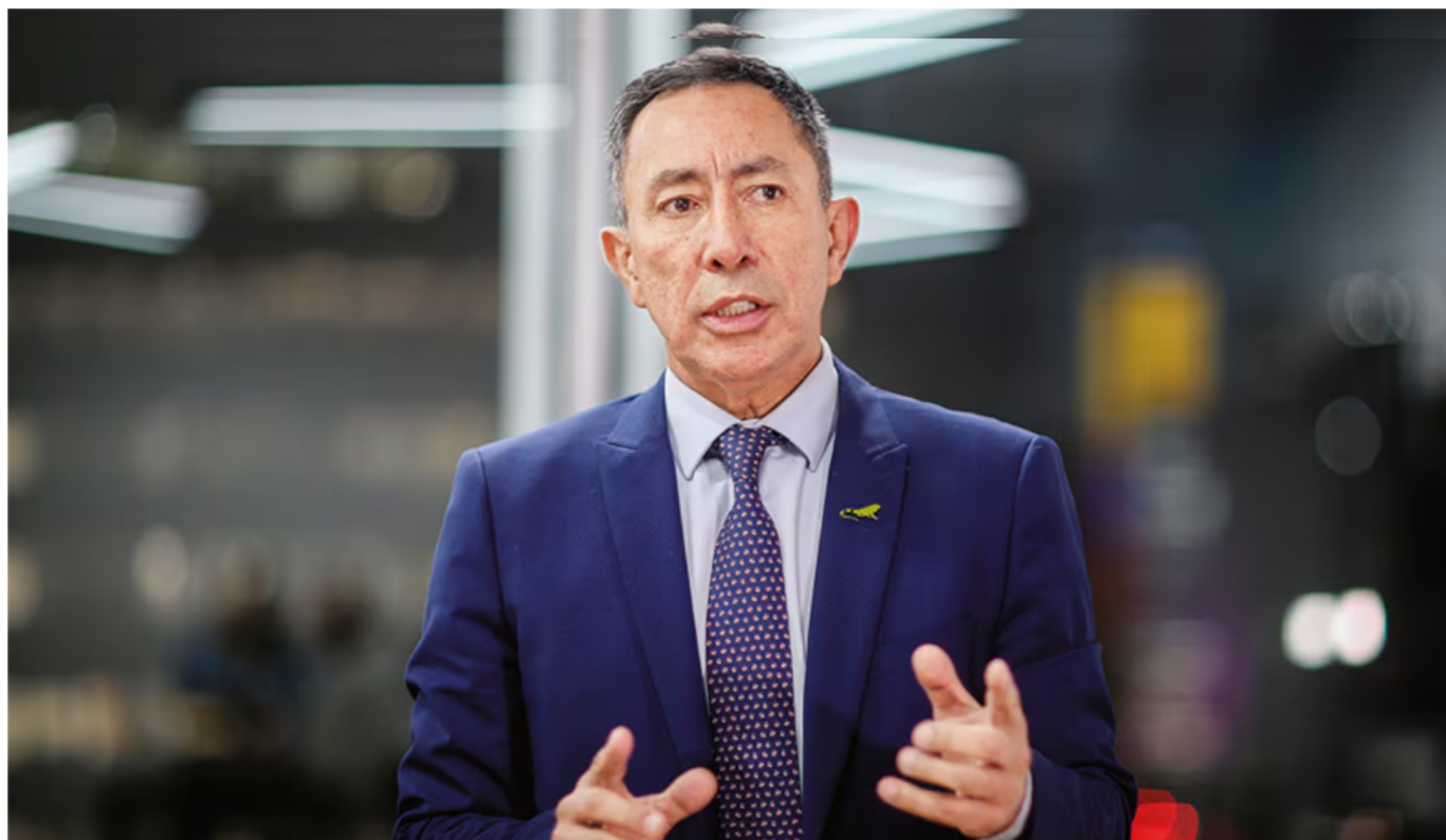
Ricardo Roa, presidente de Ecopetrol, anunció posible alza de precio en el gas natural.

31 de julio de 2024 Por: Redacción El País