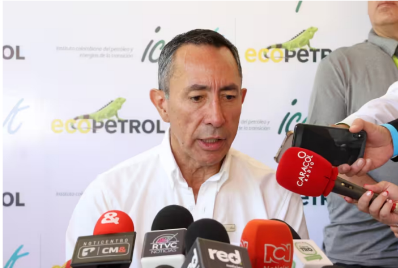
Ricardo Roa, presidente de Ecopetrol , durante el lanzamiento del ICPET.