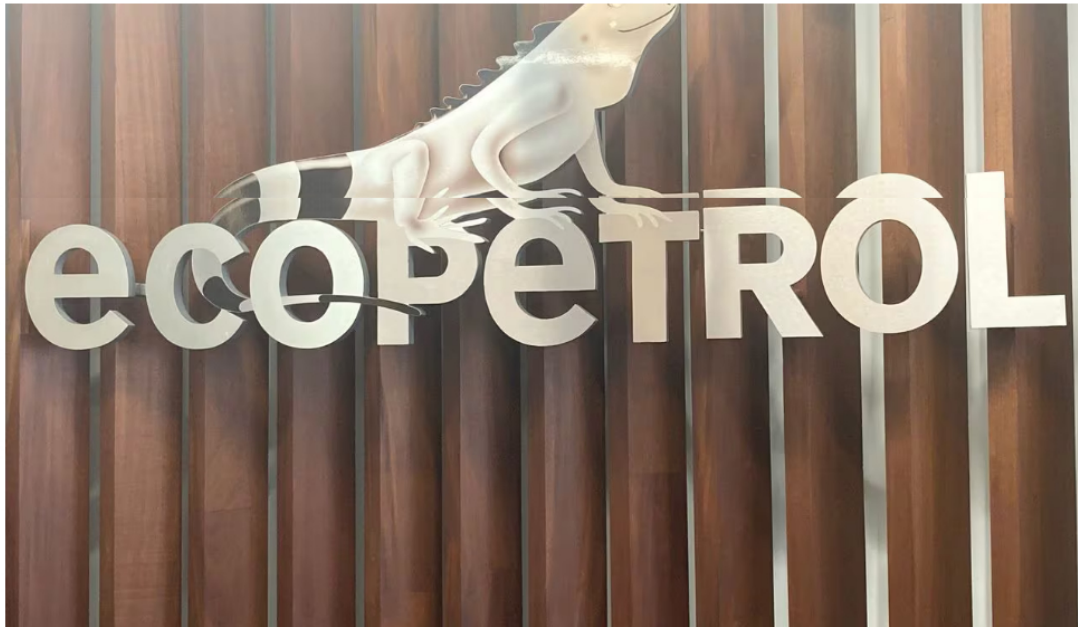
Logo Ecopetrol

26 de abril de 2024 Por: Redacción El País