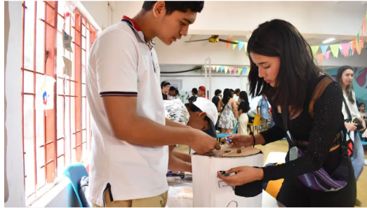
Podrán acceder jóvenes entre los 14 y 28 años con énfasis en resolución de problemas territoriales en el Magdalena Medio.

Comparte Ecopetrol y el Laboratorio de Innovación para la 4ta. Revolución Industrial de la Universidad Nacional de Colombia (UNLab 4.0) abrieron un nuevo capítulo del programa "Jóvenes 4.0 Innovando y Transformando Territorios" en los municipios de Cantagallo, Bolívar, Yondó, Antioquia y el Distrito de Barrancabermeja en el Magdalena Medio.