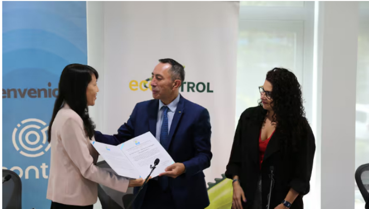
La certificación se entregó a 8 campos de producción y las refinерías de Cartagena y Barrancabermeja.