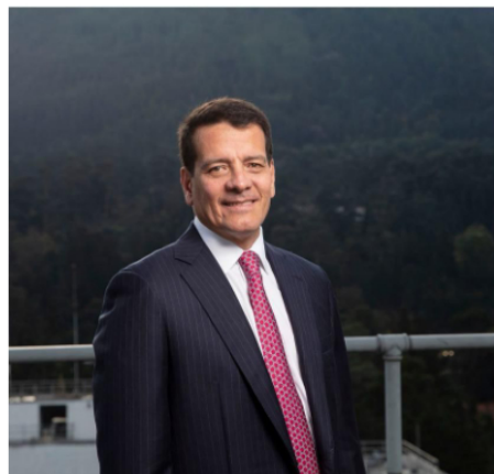
Foto: Felipe Bayón, expresidente de Ecopetrol y líder sector energético

Entre las conferencias más esperadas del día está la de Felipe Bayón , expresidente de Ecopetrol y líder del sector energético en Colombia, quien hablará sobre “ Decisiones empresariales en momentos de cambio ”, teniendo en cuenta la actualidad del sector y su visión ante la coyuntura local y nacional.