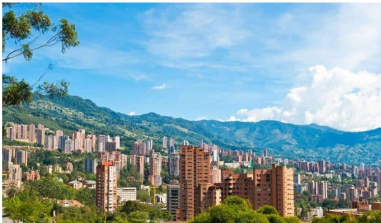
Panorámica de Bogotá.

Este 25 de abril Camacol Bogotá y Cundinamarca realizará la edición número 58° de la Asamblea Anual de Afiliados , el evento más importante de la Regional que este año cuenta con una agenda que incluye conversaciones sobre la visión de ciudad y región, política de hábitat y vivienda, desafíos de la economía y el papel del tejido empresarial del sector en la reactivación.