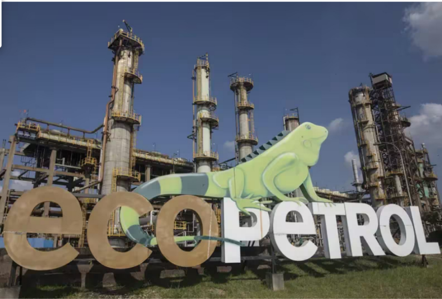
Nuevo rifirrafe entre Ecopetrol y la USO: ¿se está cumpliendo la convención colectiva? (Ivan Valencia)

El Mintrabajo adelantó un encuentro con Ecopetrol y la USO, su sindicato más grande, para hacerle seguimiento a denuncias de presuntos despidos injustificados que hizo el sindicato y a los acuerdos de la Convención Colectiva