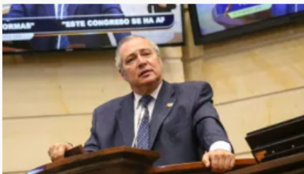
"Presidente, nadie lo va a tumbar", Name a Petro