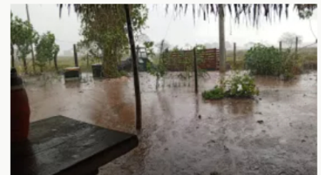
Gobierno Nacional pide a alcaldes no bajar la guardia ante alto riesgo de deslizamientos