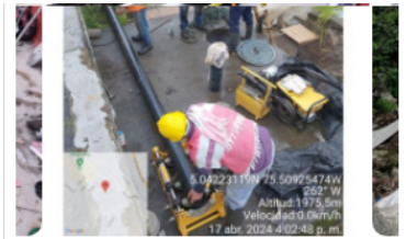
Suspensión de agua en Villamaría fue por válvula de un tanque

Gas natural Gobierno colombiano Ecopetrol Contratos de exploración Efigás Venezuela