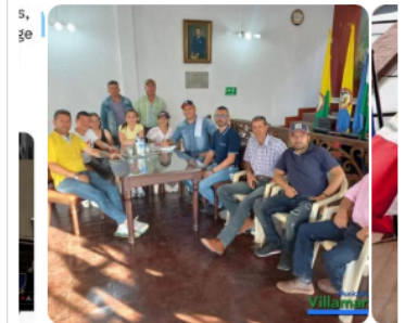
Según la página de Facebook del municipio, la Secretaría de Gobierno se reunió con representantes de los caballistas.