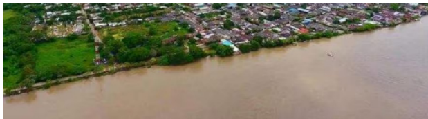
Barrancabermeja fue sancionada y ya no tiene autonomía para gestionar los recursos de regalías, tras obtener bajas calificaciones en dos años consecutivos.

Inundado, así quedó el centro comercial Unicentro por aguacero en Bogotá