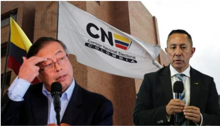
La campaña presidencial de Gustavo Petro es investigada por presunta financiación ilegal.