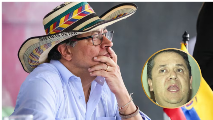
Abogado del presidente ante el CNE renunció a ser la defensa

Se complejiza para el presidente Gustavo Petro el curso investigativo que persigue esclarecer la financiación de su campaña presidencial de 2022.