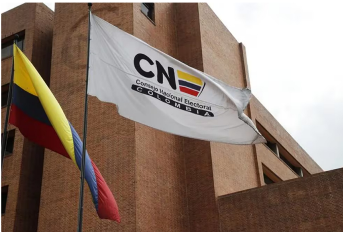
Consejo Nacional Electoral aceptó solicitud para aplazar audiencia del presidente de Ecopetrol Ricardo Roa

Concretamente, se examina el uso de la aeronave de matrícula HK-5328, perteneciente a Sadi S.A.S., que habría sido utilizada para transportar al entonces candidato presidencial y a varios aspirantes al Congreso por el Pacto Histórico.