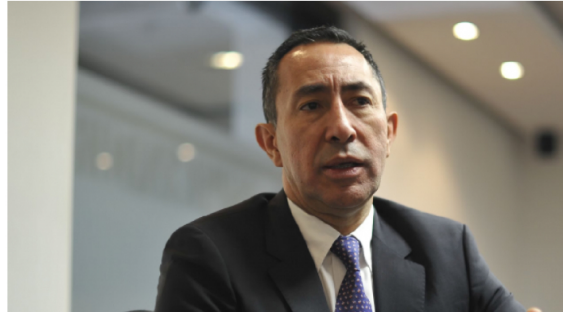
Ricardo Roa Barragán - presidente de Ecopetrol

Publicado: Jueves, Abril 18, 2024 - 13:24 | Actualizado: Jueves, Abril 18, 2024 - 15:45