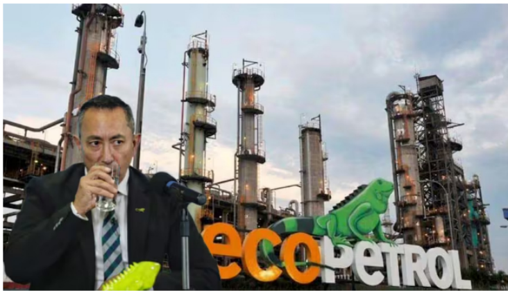
Ricardo Roa llegó a la presidencia de Ecopetrol luego de haber sido gerente de la campaña Petro Presidente en 2022. Según denuncias, a la contienda electoral habrían entrado dineros que no se reportaron ante el Consejo Nacional Electoral.