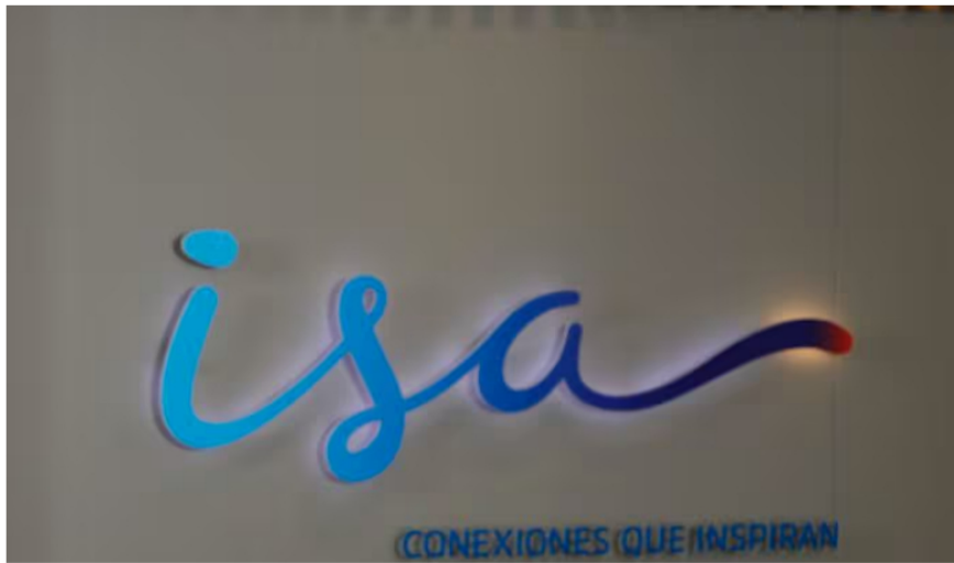
Logo de ISA.