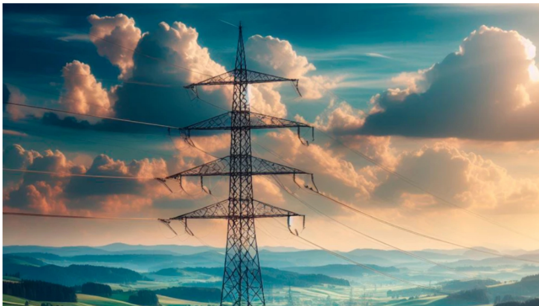
Torre de energía

Por: Redacción BLU Radio | 17 de Abril, 2024