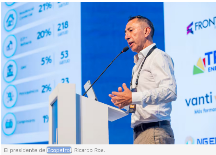
El presidente de Ecopetrol, Ricardo Roa.