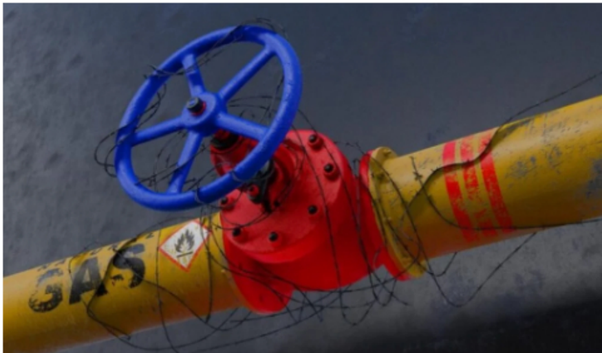
Gasoducto desde Venezuela tomará hasta 12 meses en ser reparado del lado colombiano.

De acuerdo con los cálculos de Roa, una vez entre en operación ese gasoducto puede transportar unos 200-300 millones de pies cúbicos de gas por día.