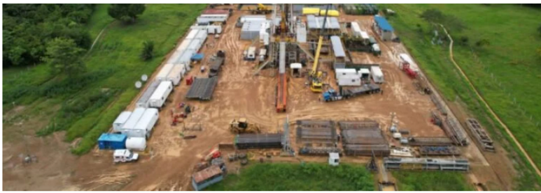
Sobre Arrecife, Guzmán relató que es un bloque en Córdoba, en el municipio de Pueblo Nuevo.