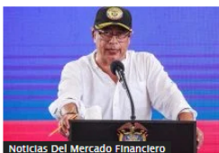
Noticias Del Mercado Financiero Gobierno Petro ahora sí plantea