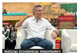
Noticias Económicas Importantes Nuevo presidente de Grupo Éxito