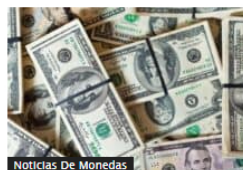
Noticias De Monedas Dólar en Colombia aumenta por