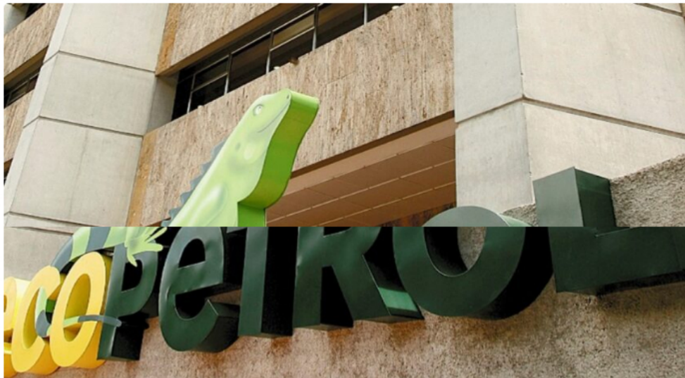
Ecopetrol es Sostenimiento y Desarrollo en el Meta

REGIÓN | abril 11, 2024 | 1 | 2 minutes read