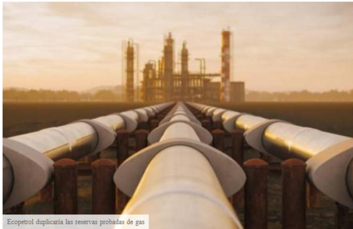
Ecopetrol duplicaría las reservas probadas de gas

TRENDS Letha Trend about 9 hours ago REPORT