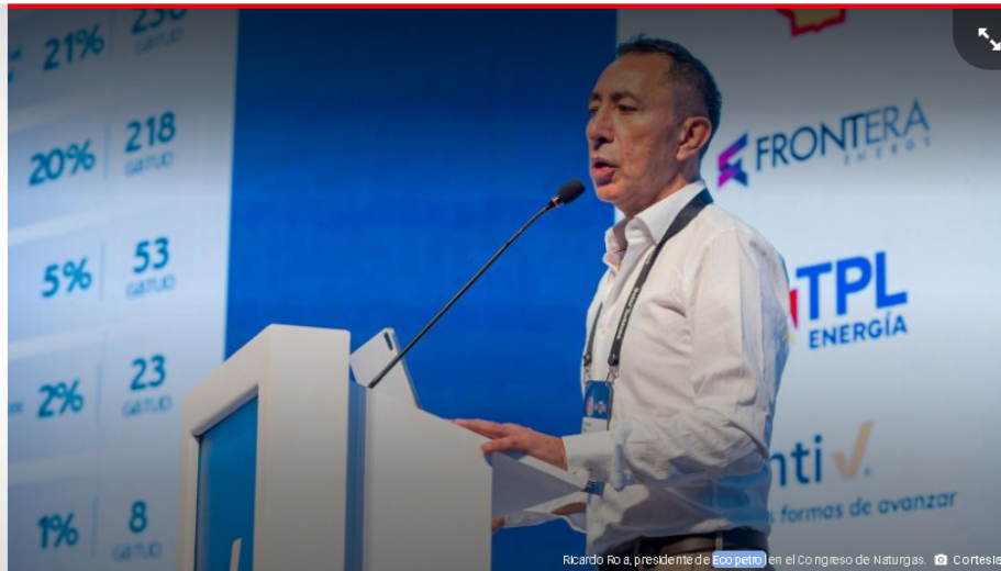
Ricardo Roa, presidente de Ecopetrol en el Congreso de Naturgas.

De acuerdo con la estatal petrolera, la producción inicial de este campo se estima entre 5 a 10 millones de pies cúbicos por día y ya están disponibles en el mercado local.