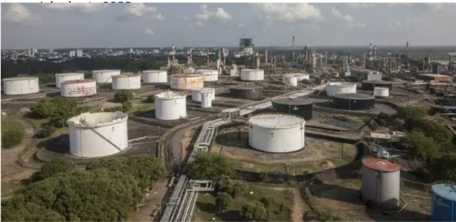
Descubrimiento de gas de Ecopetrol llega al mercado justo en un momento crucial (Ivan Valencia)

Estima que la producción potencial del campo será de entre 20 y 30 millones de pies cúbicos por día para 2026 y espera tener producción de gas en cantidades