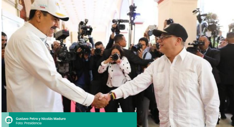
Gustavo Petro y Nicolás Maduro

El presidente Gustavo Petro entregó un balance de su paso por el país vecino.