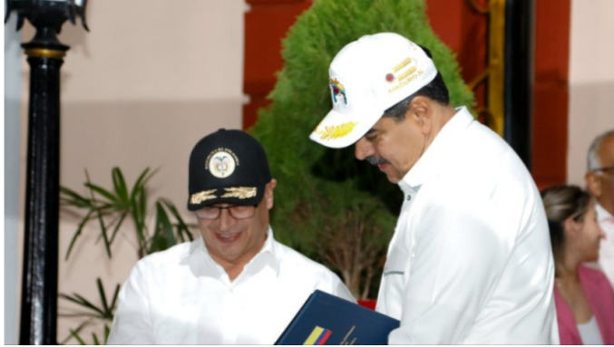
Petro y Maduro

Venezuela y Colombia habrían estudiado la posibilidad de celebrar un acuerdo energético relacionado con la explotación de hidrocarburos y la venta de energía , de acuerdo a lo revelado este miércoles por el presidente de Colombia, Gustavo Petro, a través de su cuenta en la red social Instagram.