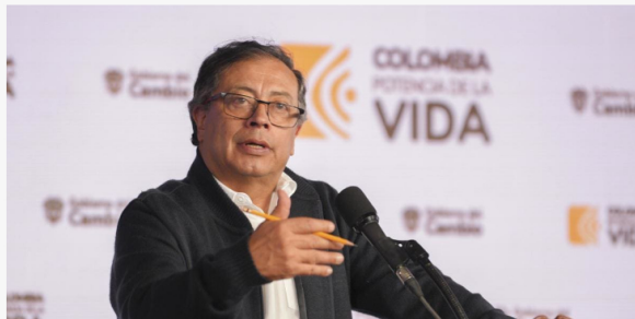
Controversia porque Petro dice que dineros que aportan cafeteros son de