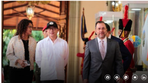
El presidente Petro a su llegada al Palacio de Miraflores.

"Fue un viaje rápido con el propósito de profundizar la agenda común, que tiene que ver con un acuerdo energético con la posibilidad de que Ecopetrol pueda explotar gas en la frontera cerca a Colombia y petróleo en condiciones de alta calidad más cerca de Norte de Santander", indicó el primer mandatario colombiano.