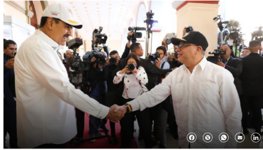
Nicolás Maduro y Gustavo Petro.

futuro, pero ha ayudado a mitigar el déficit comercial que traía el país , añadió el presidente Petro, que indicó que podría ser mayor si se levantan las sanciones al régimen Maduro.