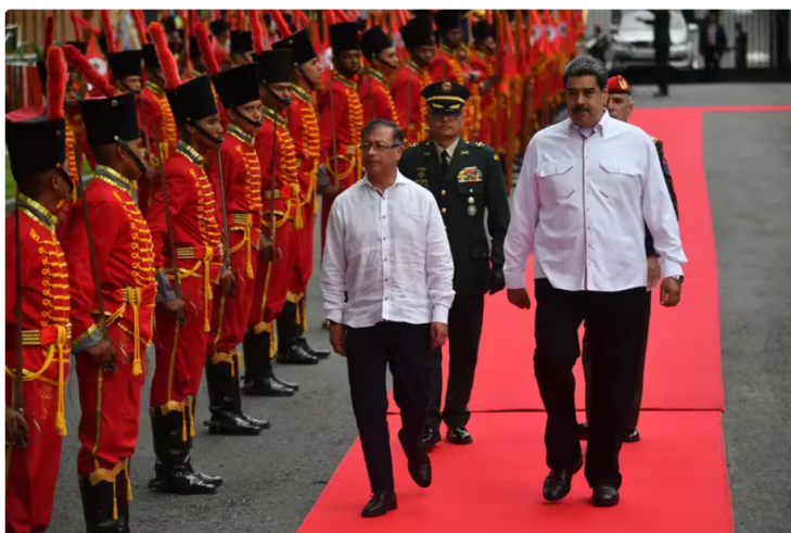
Gobierno de Colombia busca acuerdo para permitir a Ecopetrol producir petróleo y gas venezolanos Ecopetrol podría desarrollar petróleo y gas de "alta calidad" en el oeste de Venezuela bajo el acuerdo y Colombia podría exportar energía limpia a su vecino.

El presidente colombiano dijo que el petróleo y el gas se desarrollarían en campos venezolanos cerca de la provincia colombiana de Norte de Santander