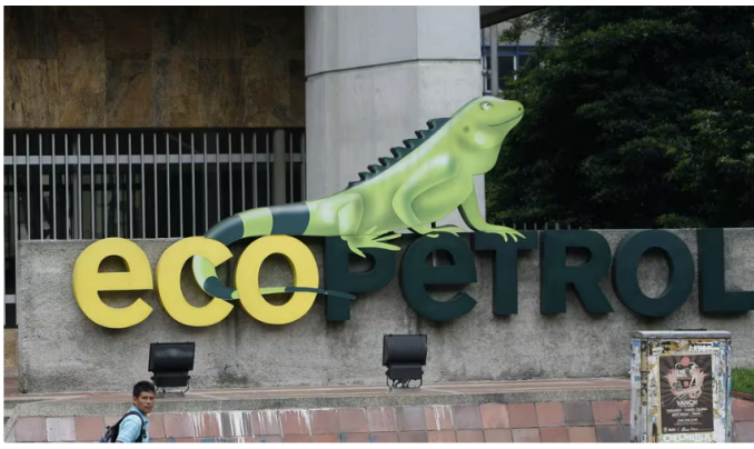
El gerente de Ecopetrol indicó que se plantea la posibilidad de importar 200 metros cúbicos de gas natural. Imagen de referencia

El acuerdo mencionado ya ha obtenido los votos necesarios para su aprobación y solo resta una audiencia formal para concretar la propuesta venezolana de liquidar todas las deudas en un plazo no mayor a un año. El plan de negocios de PDVSA Gas de Colombia contempla inversiones para la rehabilitación del Gasoducto Transcaribeño Antonio Ricaurte y sus estaciones asociadas , con el fin de restablecer la operación y cumplir con los Acuerdos Binacionales en materia de Hidrocarburos Gaseosos en menos de un año tras la confirmación del acuerdo.