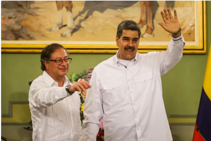
Venezuela, encabezada por Nicolás Maduro aseguró que se podrán al frente de la deuda. Imagen de referencia

Frente a las preocupaciones por un posible desabastecimiento, gremios como la Asociación Colombiana del Petróleo y Asoenergía han reconocido la urgencia de adoptar medidas, anticipando un déficit de gas a partir de 2025 o 2026.