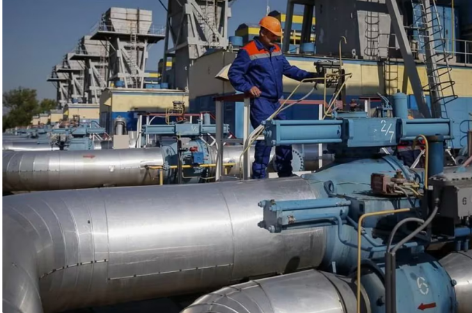
Importar el gas desde Venezuela saldría más barato que hacerlo desde otros países. Imagen de referencia

El contrato vigente, que inicialmente implicó la venta de gas de Colombia a Venezuela y posteriormente la devolución del mismo, se mantiene activo hasta diciembre de 2027.