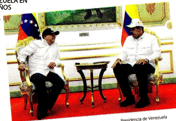
Presidencia de Venezuela

Ayer se realizó el encuentro entre los presidentes, Gustavo Petro y Nicolás Maduro, en Caracas.