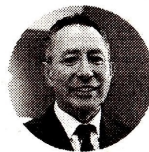
Ricardo Roa Presidente de Ecopetrol

En la reunión se trataron temas relacionados con energía, gas, petróleo y seguridad fronteriza. "Conversaremos seguro muchos temas que hay, el asalto a la Embajada de México en Ecuador, el tema palestino, el fortalecimiento