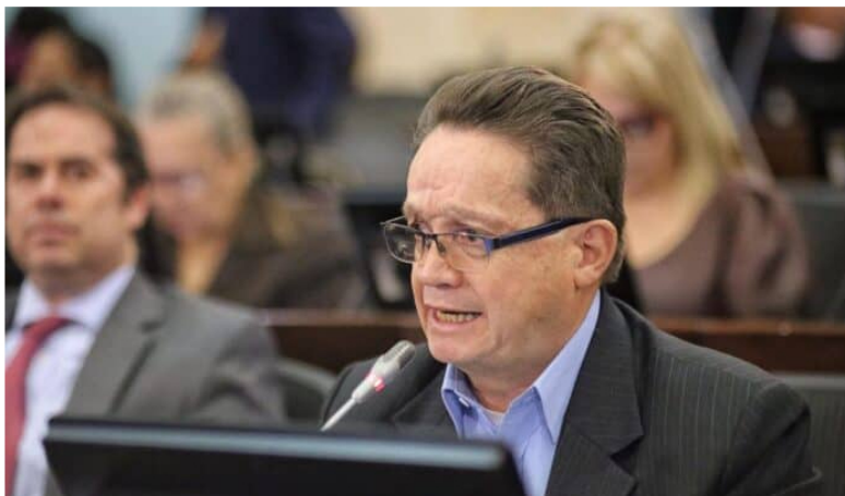
Guillermo García Realpe, nuevo presidente de la Junta Directiva de Ecopetrol.

El recién nombrado presidente de la Junta Directiva de Ecopetrol , Guillermo García Realpe, se refirió a su llegada a la empresa y a la posible firma de nuevos contratos de petróleo y gas en Colombia.