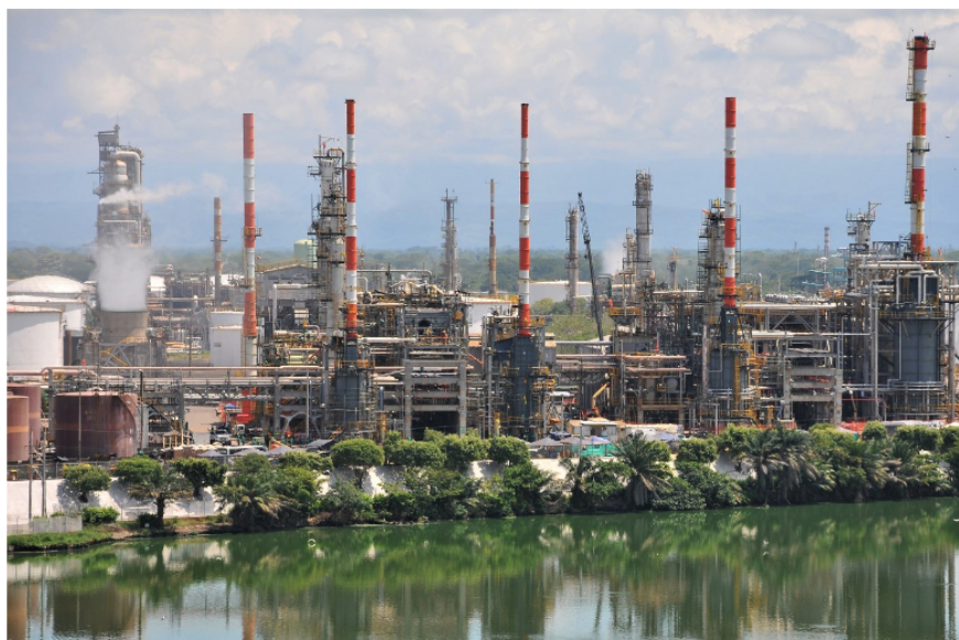
Ecodiésel recibió certificación Icontec de carbono neutro.

certificación Icontec de carbono neutro y en la refinería de Cartagena avanza el proyecto de combustible sostenible de aviación (SAF).