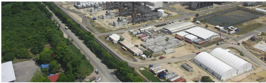
En la refinería de Cartagena avanza el proyecto de combustible sostenible de aviación (SAF).

La carga de la refinería de Barrancabermeja fue la más alta de los últimos 16 años, con un promedio de 240 mil barriles diarios en el último trimestre del 2023, mientras que la refinería de Cartagena logró una carga de 198 mil barriles diarios promedio año, debido a la operación continua del Proyecto de Interconexión de las Plantas de Crudo (IPCC).