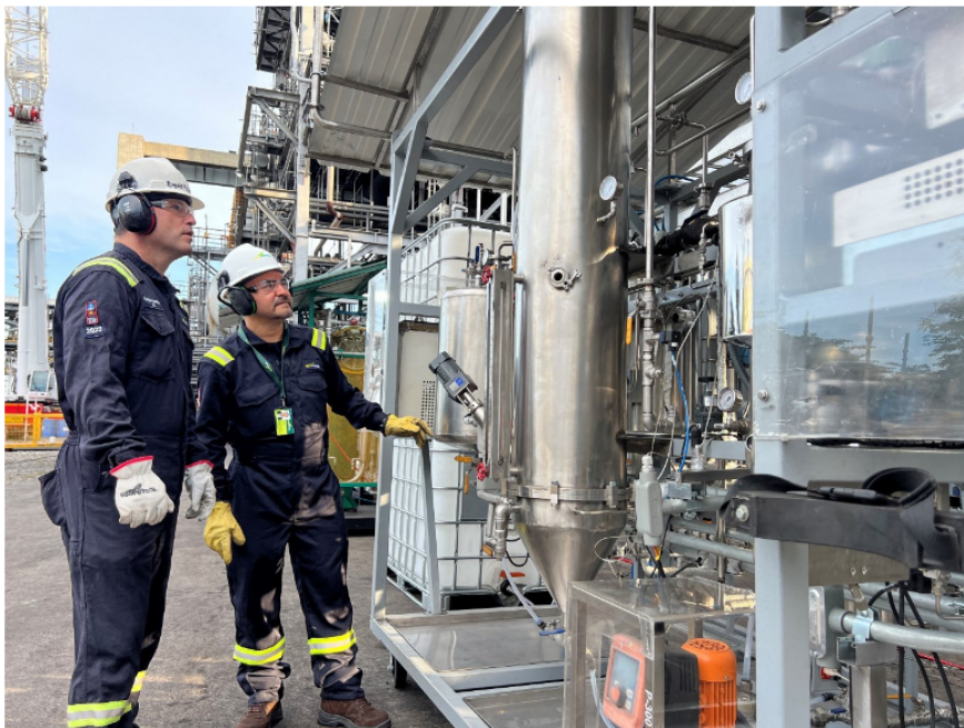
El aumento en la producción de gasolina, diésel y jet contribuyó a reducir las importaciones

Los factores que hicieron posible la obtención de estos resultados fueron: la disponibilidad operacional de las unidades de proceso, con 95,3%, la más alta de los últimos cinco años; la maximización de las cargas de las unidades de refinación de crudo, craqueo catalítico y alquilación; el aprovechamiento de la disponibilidad de crudo liviano despachado desde Caño Limón y el aseguramiento de la evacuación de fondos de vacío.