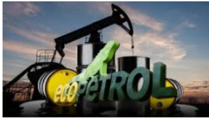
Guillermo García descartó nuevos contratos de exploración para Ecopetrol

Por qué es importante: En cuanto a la firma de nuevos contratos de exploración de petróleo y gas, el presidente de la Junta de Ecopetrol clarificó que la empresa no buscará nuevos contratos en el corto plazo. En su lugar, se enfocará en maximizar el potencial de los campos ya explorados, mencionando la identificación de 23 pozos con alta probabilidad de éxito y la posibilidad de aplicar técnicas modernas en pozos abandonados para aumentar la producción de crudo.