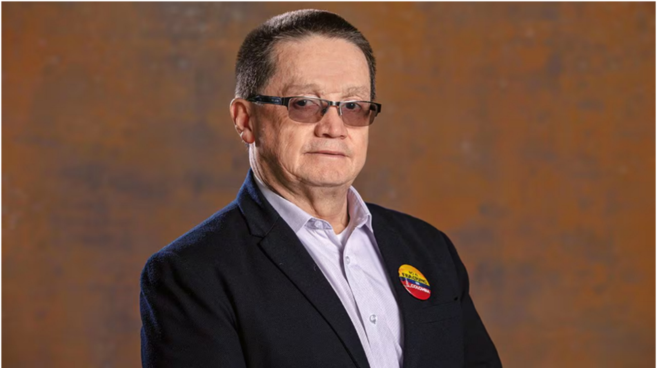
El excongresista lideró la disidencia del Partido Liberal que acompañó a Gustavo Petro desde 2018. En Nariño le reclaman por los supuestos incumplimientos desde que Petro llegó a la presidencia de la república.