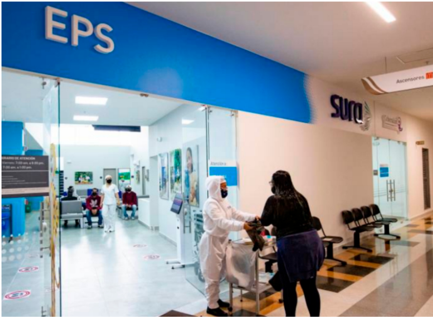
La EPS Sura tiene cerca de 4,8 millones de afiliados en Colombia.

Es innegable el difícil momento que atraviesa el sistema de salud colombiano. Sin embargo, Sura se las está arreglando para garantizar servicios, pero bajo el ala de su negocio de seguros y no como EPS.