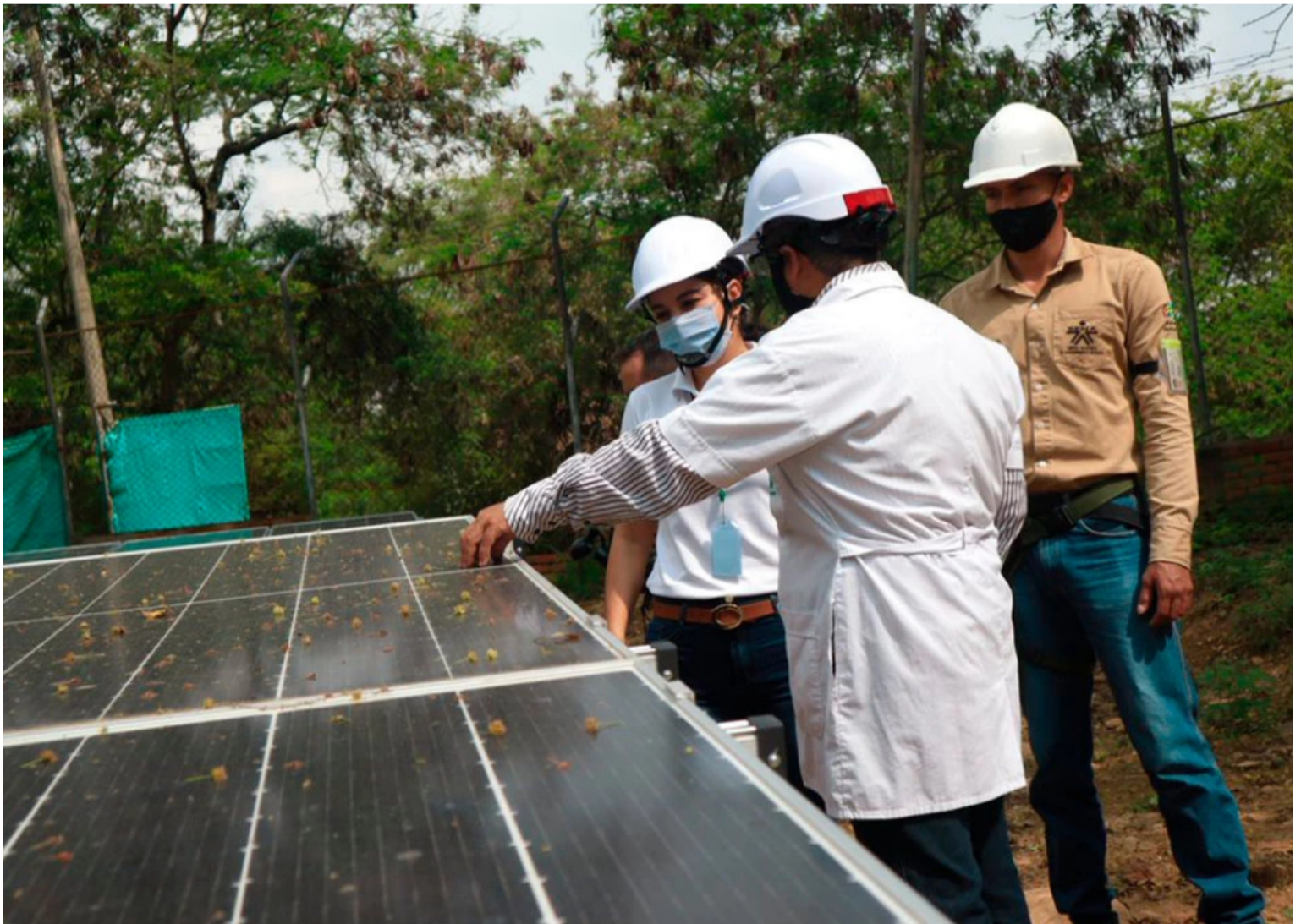
BLU Radio. Paneles solares SENA Girón / Foto: SENA Santander

En este momento el proyecto se encuentra en la fase de socialización, posteriormente se presentará el documento final al Consejo Superior de la UIS para la creación del instituto.