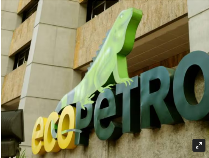
Ecopetrol