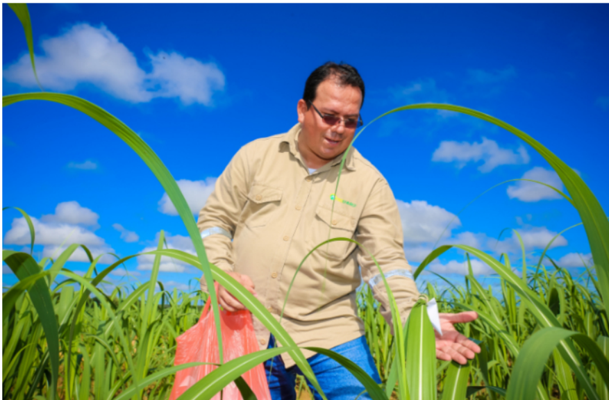
La caña de azúcar permite convertir la energía del sol, el dióxido de carbono y el agua en grandes cantidades de azúcar. Queda un remanente de melaza que se fermenta, y es una de las materias primas para elaborar alcohol 96°.

¿Quién responde por esos recursos públicos despilfarrados? Aún no hay responsables por el que podría ser uno de los fracasos empresariales más lesivos de la historia del país