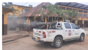
Ante la circulación del virus del dengue, se adelantarán jornadas de fumigación en Villanueva y Tauramena 15 agosto, 2023 En «Salud»