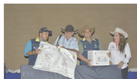
Familias vulnerables de Tauramena recibieron ayudas humanitarias 3 abril, 2024 En «Noticias»