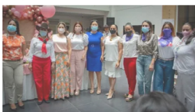
NACE EN CASANARE, EL SEMILLERO DE MUJERES JÓVENES LÍDERES POLÍTICAS 9 marzo, 2021 En «Institucional»