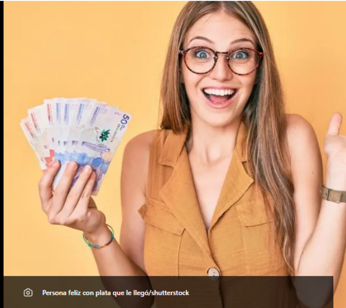
Persona feliz con plata que le llegó