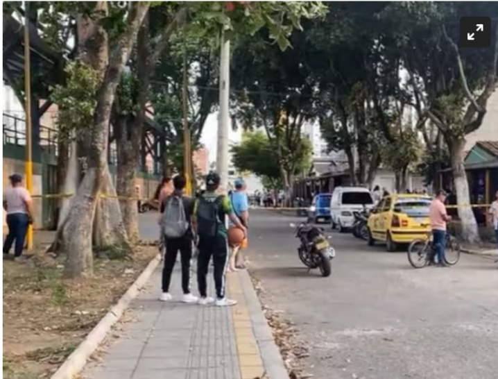
Doble homicidio en Girón, Santander.

Ofrecen recompensa para ubicar al autor del asesinato del contratista de Ecopetrol y comerciante de Barrancabermeja.