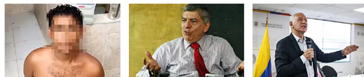
“Queda de...” “Queda en...” “Ministro de Salud...”