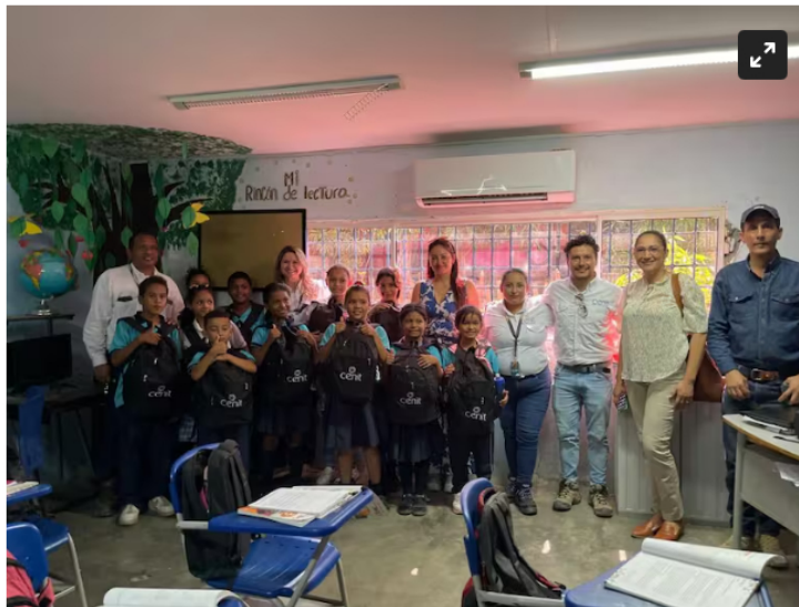
Más de 2.800 kits escolares son entregados a estudiantes de Don Jaca y Aeromar

En alianza con empresas privadas un sinnúmero de niños es beneficiados al recibir más de 2.800 kits escolares para su formación educativa.