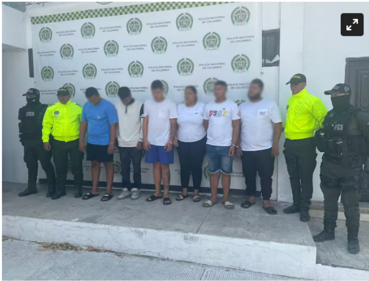
Banda ‘Los Toderos’. Policía Nacional

Con el objetivo de hurtar 4 teléfonos de alta gama al día, los capturados perfilaban a sus víctimas especialmente mujeres y ciudadanos extranjeros.