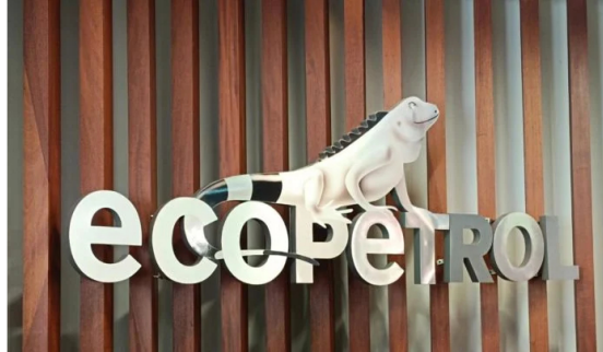
Ecopetrol abre filial en Estados Unidos.

Este martes, 2 de abril, el Grupo Ecopetrol inauguró las oficinas de su filial Ecopetrol US Trading en la ciudad de Houston, Estados Unidos, considerada la capital de la industria de los hidrocarburos en el mundo.