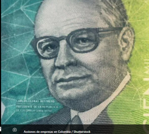
Acciones de empresas en Colombia