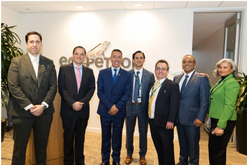
Inauguración de Ecopetrol US Trading.

Recientemente, Ecopetrol ha anunciado el inicio de operaciones de Ecopetrol US Trading, como parte de su estrategia de internacionalización.