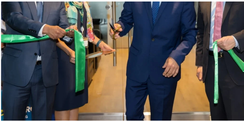
Inauguración de Ecopetrol US Trading.

Según un representante de la compañía, la apertura de Ecopetrol US Trading en Houston es esencial para su estrategia global.