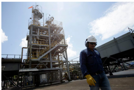
El Grupo Ecopetrol busca posicionarse en el mercado con un mayor volumen de actividades y electroquímicas durante los próximos años.

En esta ciudad, que es considerada la capital de la industria de los hidrocarburos en el mundo, se inició la operación de Ecopetrol US Trading que hace parte de la estrategia de internacionalización de la empresa, junto con las oficinas de Bogotá y Singapur.