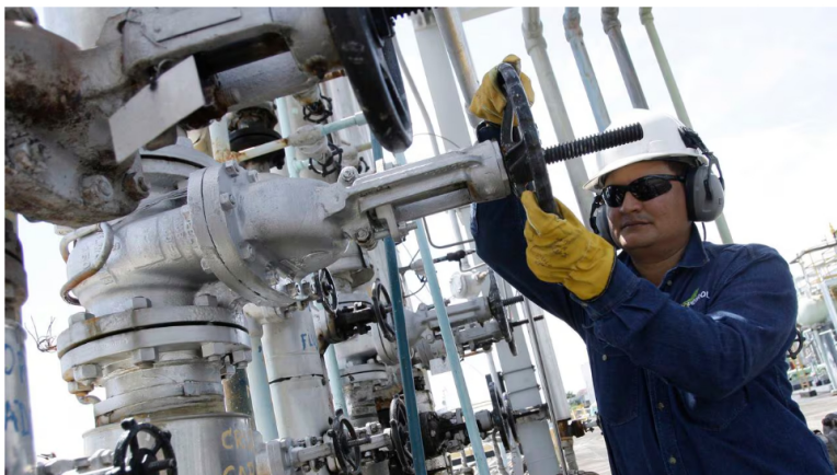
Nueva filial tiene como objetivo contribuir en la transición energética.

2 de abril de 2024 Por: Redacción El País