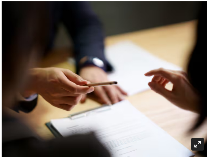
Imagen de referencia.

Cuenta con más de 20 años de experiencia en el sector; ha desempeñado roles destacados en empresas como Ecopetrol y Petrobras. Su llegada a la dirección del Fondo de Energías no Convencionales y Gestión Eficiente de la Energía se da tras la salida de Pablo Barrera.