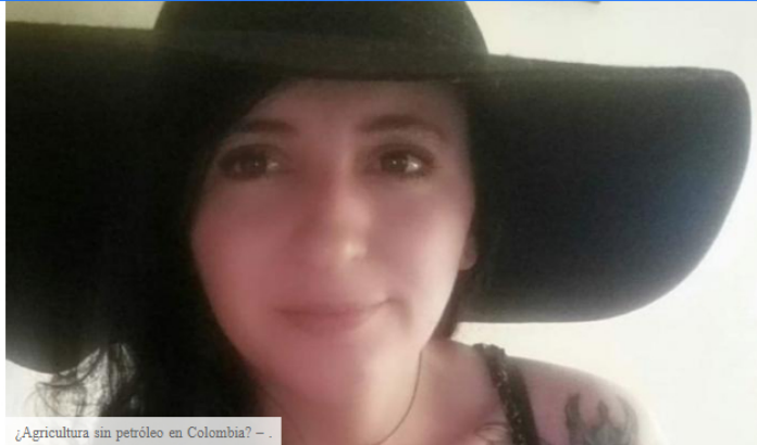
¿Agricultura sin petróleo en Colombia? – .

Si se opta por no continuar con la búsqueda de petróleo en Colombia y ECOPETROL cambia su enfoque, la dependencia de las importaciones de insumos para la producción de alimentos aumentaría significativamente, generando mayores costos de insumos y generando un riesgo para la seguridad alimentaria del país.