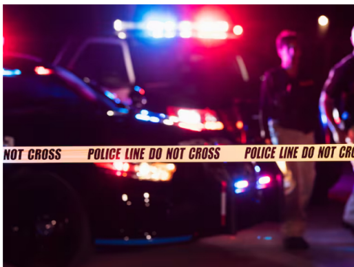
Imagen de referencia de un tiroteo.

La Policía ha indicado que el tiroteo se ha debido a un “altercado” entre dos personas