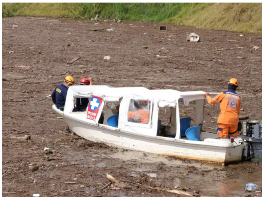
Atienden emergencia por avalancha en Pasto

La medida será sectorizada para atender la zona de la emergencia