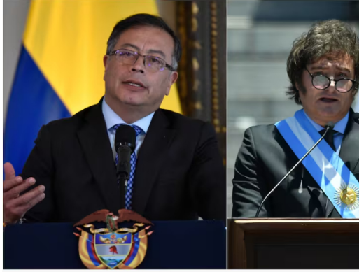
El presidente colombiano, Gustavo Petro (izq) y el candidato presidencial argentino, Javier Milei (der).

El Gobierno colombiano ha dado indicaciones para que el Embajador Camilo Romero regrese a Buenos Aires. El Gobierno argentino, por su parte, ha anunciado la visita a Colombia de su Canciller, Diana Mondino.